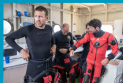
Préparatifs avant départ © Jordi Chias_ Gombessa 5

Libres de droits avec respect du crédit photo indiqué