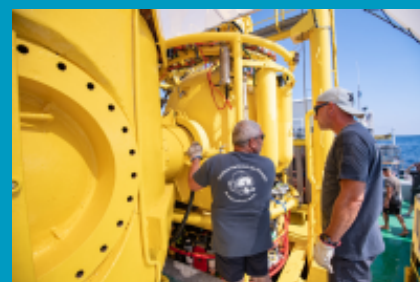
Vérification Station Bathyale Théo Mavrostomos INPP - en charge de la station Bathyale © Jordi Chias_ Gombessa 5